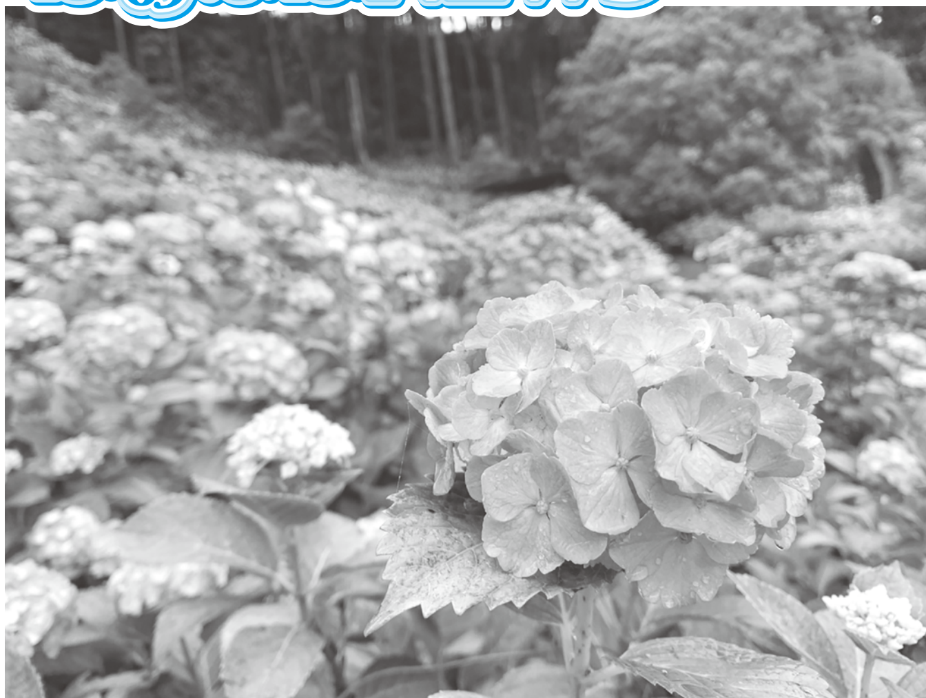
【服部農園あじさい屋敷(茂原市)】