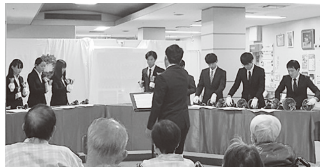
三育学院大学聖歌隊によるハンドベル