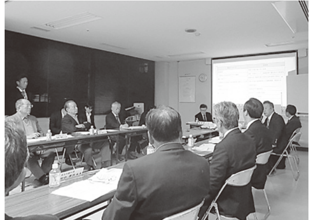
あり方検討委員会の様子

中長期ビジョンの策定にあたり、地域医療の中で担うべき役割、提供すべき医療、病院の在り方等について検討を行い、地域住民にとって必要とされる地域医療機関としての役割を果たしうる体制を構築するため、あり方検討委員会に次の事項を諮問しました。