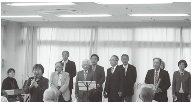
たんぼぼの会による合唱

地域の皆様がこれからも元気でいられるために今後も長生病院スタッフ一同、全力で取り組んでまいります。